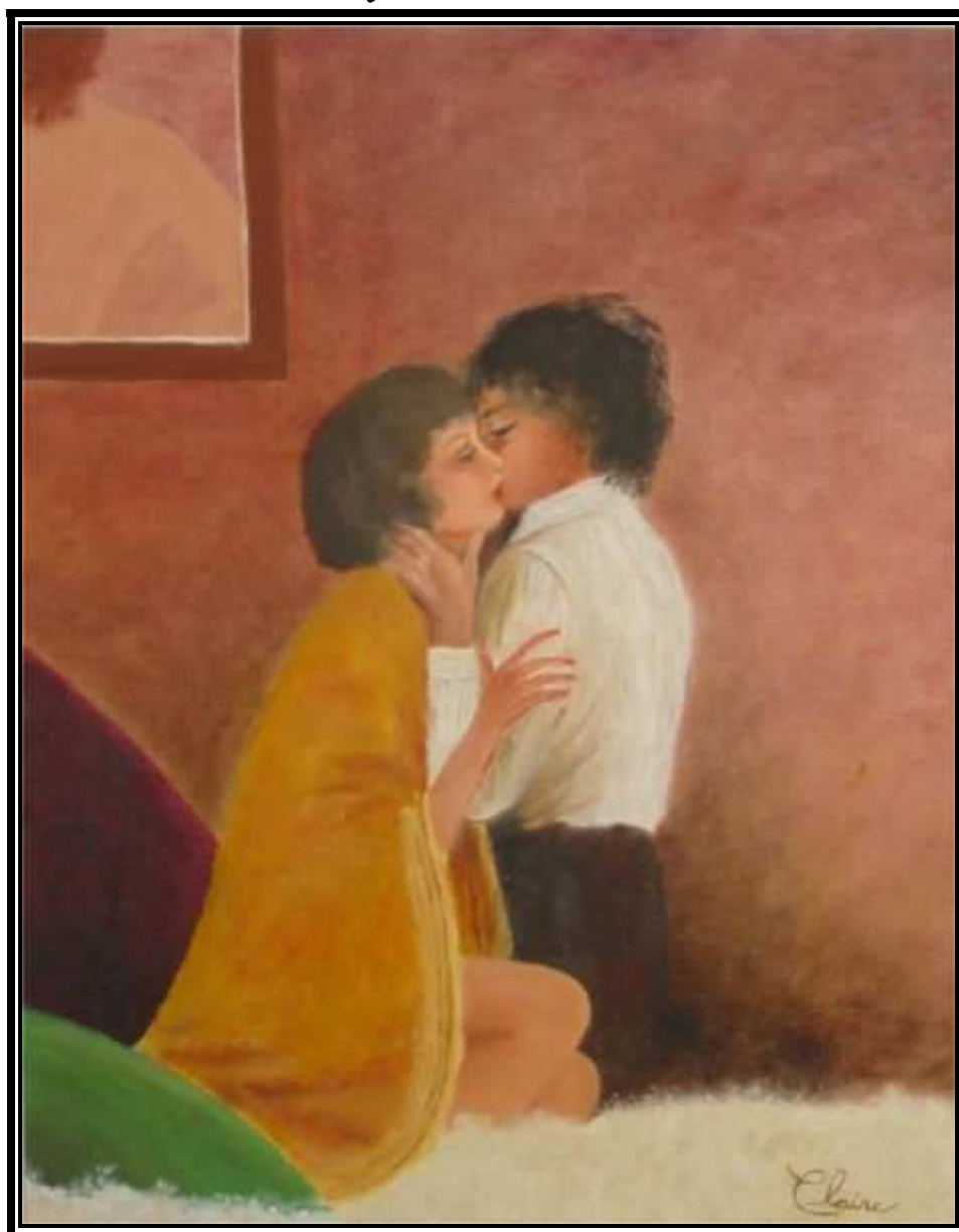
Huile sur toile de M me Claire-Hélène Cloutier Nadeau

Prochaine parution le 25 juin 2007. Les textes doivent nous parvenir au plus tard le 15 juin.