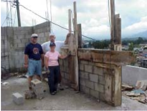
Quelques bénévoles au chantier du Projet Grupo Ceiba.