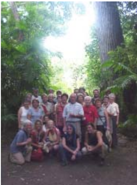
Une partie du groupe de bénévoles, lors d'une visite culturelle à Tikal, lieu où l'on retrouve de magnifiques vestiges de la civilisation maya.