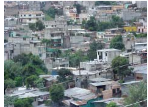
Vue du quartier « El Limon », un des quartiers les plus défavorisés de Guatemala Ciudad.