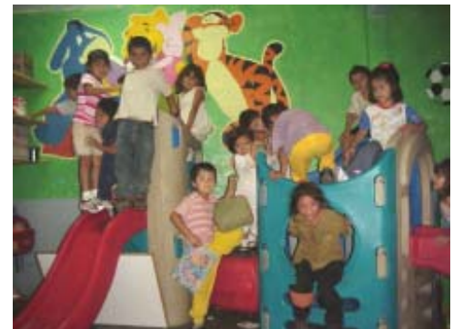
Enfants guatémaltèques dans une aire de jeux à la Garderie Ceibita.